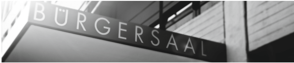
Der Bürgersaal im Herzen von Wandsbek